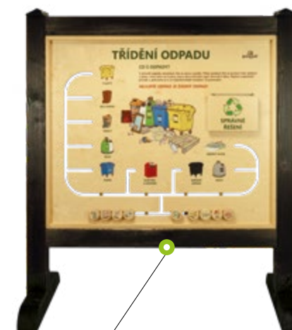
TŘÍDĚNÍ ODPADU N01580 Rozměry (š × v) 140 × 165cm