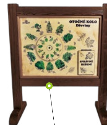
OTOČNÉ KOLO N01579 Rozměry (š × v) 120 × 150cm

Stojany nabízíme i ve variantě se stříškou.