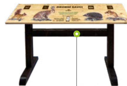
FROTÁŽOVÝ PULT N01450 Rozměry (š × v × h) 150 × 88 × 40cm