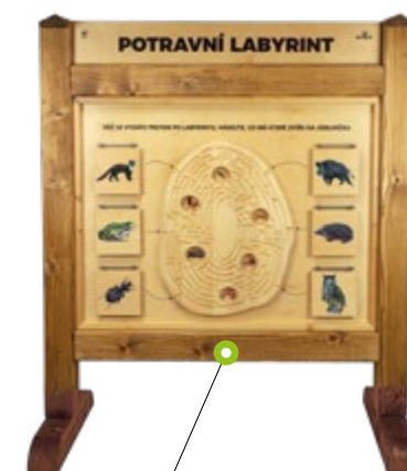
POTRAVNÍ LABYRINT N01245 Rozměry (š × v) 120 × 150cm