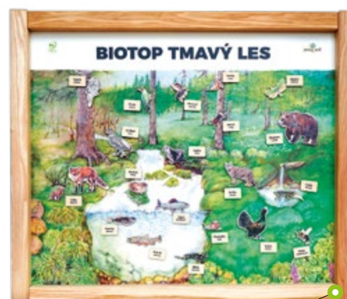
BIOTOP S MAGNETY N01250 Rozměry (š × v) 98 × 84cm