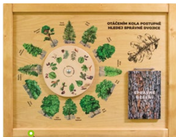
OTOČNÉ KOLO STROMY N01559 Rozměry (š × v) 108 × 84cm