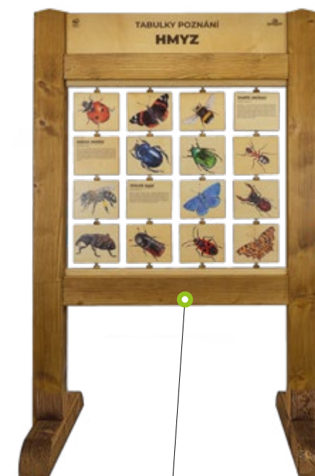
TABULKY POZNÁNÍ N01700 Rozměry (š × v) 94 × 140cm