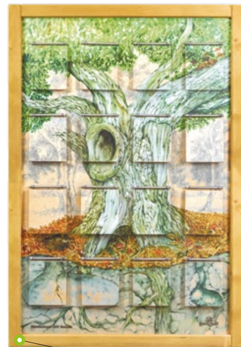
STROM JAKO DŮM N01478 Rozměry (š × v) 84 × 121cm